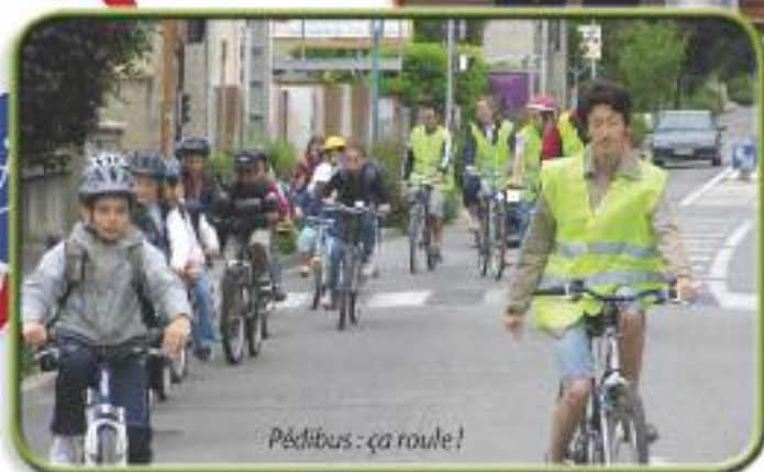
Pédibus : ça roule !