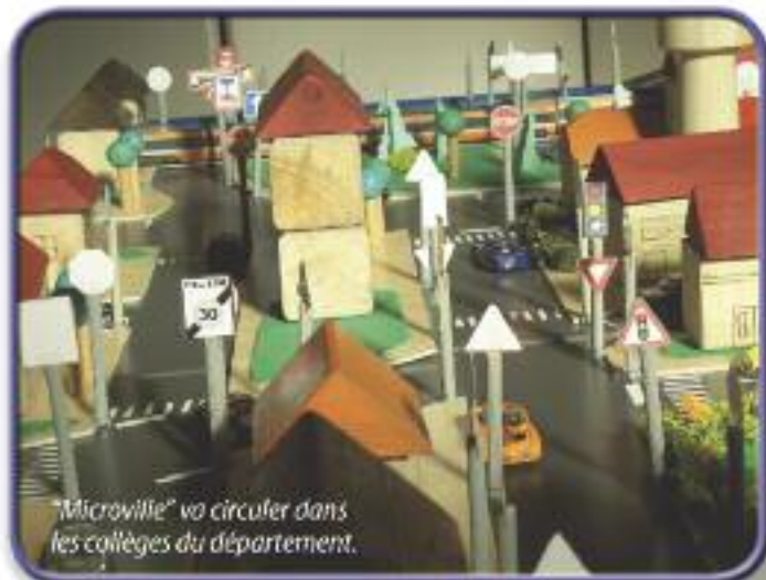
"Microville" va circuler dans les collèges du département.