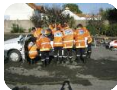
Manoeuvre sortie de véhicule du 18 octobre 2008