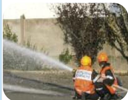
Jeunes sapeurs pompiers de l'île de noirmoutier