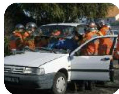
Manoeuvre de désincarcération du 18 octobre 2008