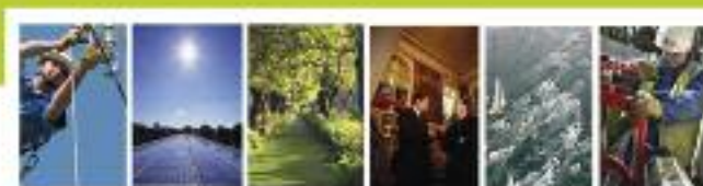
Acteurs de la dynamique vendéenne

L'énergie est notre avenir, économisons là !