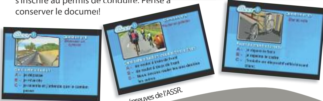
Sur le site Éduscol, les annales des épreuves de l'ASSR.