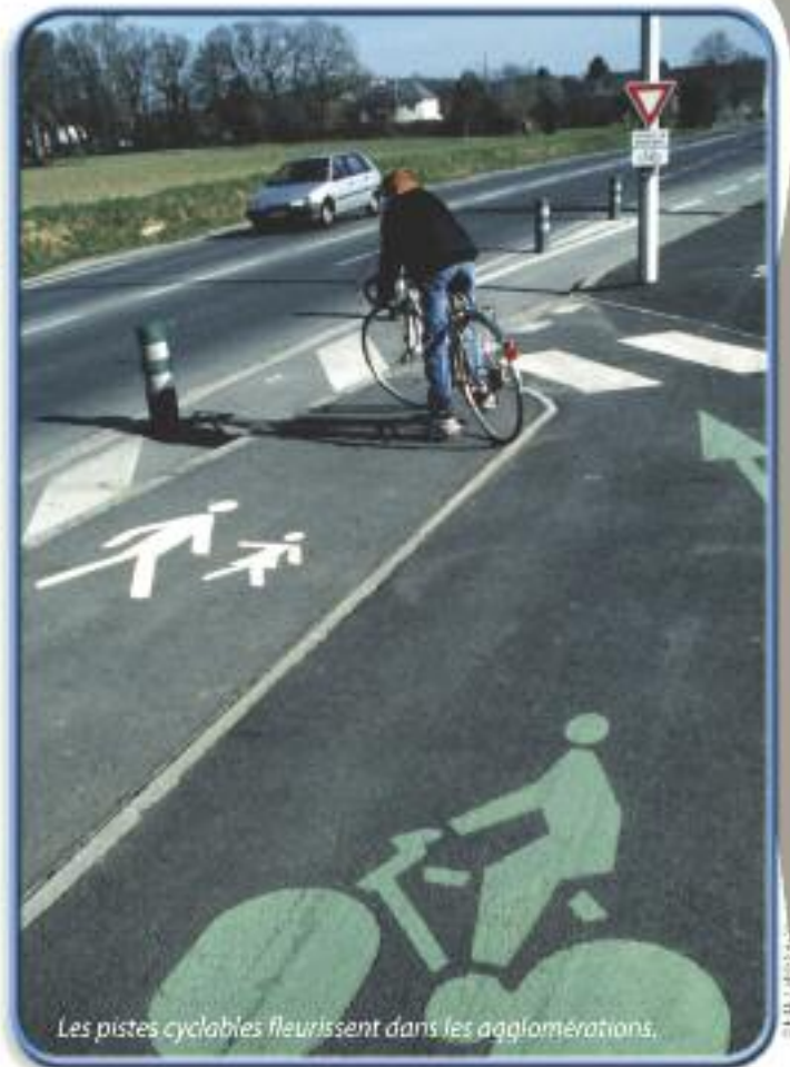
Les pistes cyclables fleurissent dans les agglomérations.