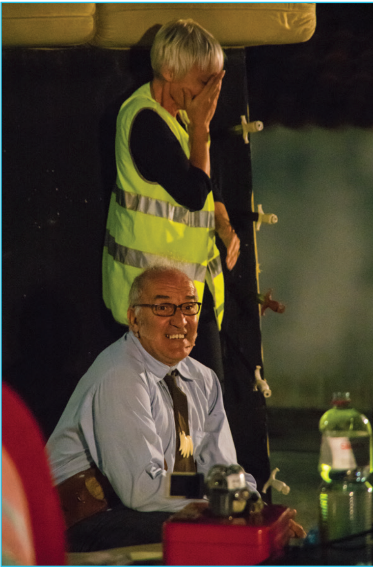
La Cie Carnage production présentait « Ma vie de grenier » dans le cadre de La Déferlante