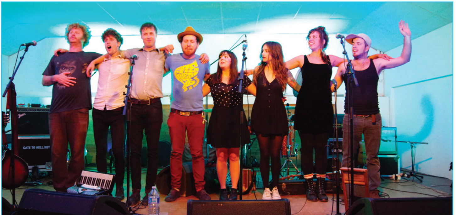
Les Canadiens de CANAILLES...