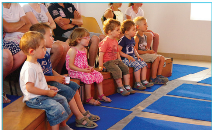
Des spectacles pour le très jeune public avec « C'est dans la poche »