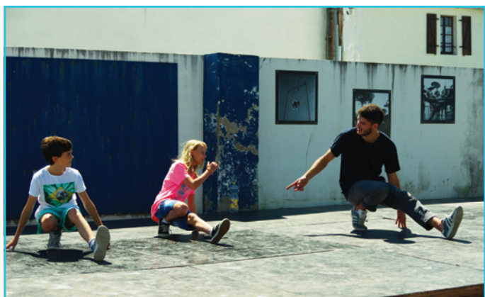
Atelier hip-hop animé par la Cie S'Poart