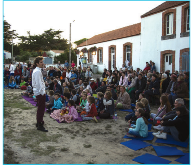
La cour des Noures pour le spectacle L'AVARE par la Cie Les Apicoles