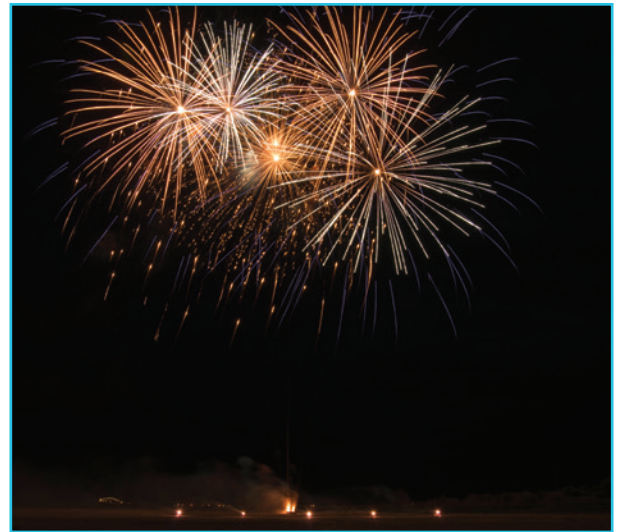
Le Feu d'artifice... record de fréquentation cette année pour un spectacle féérique...