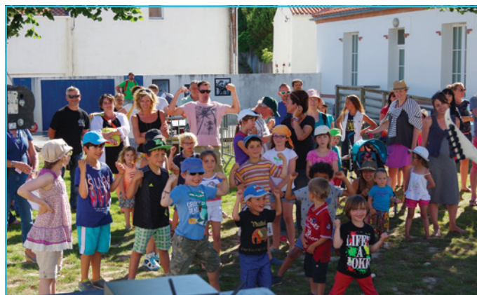
Les Bouskidou et les Kourtes Pates ont fait danser les enfants et les parents