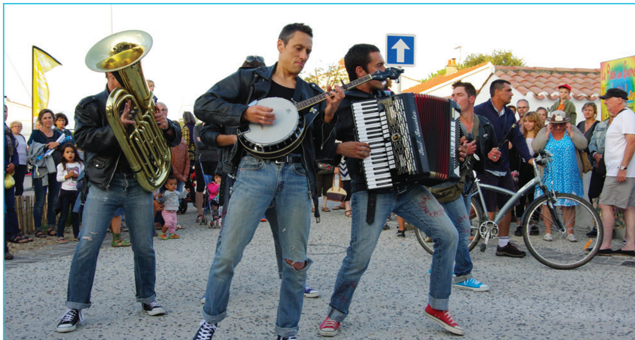
La Rue en fête a retrouvé des couleurs avec sa nouvelle formule profondément spectaculaire.